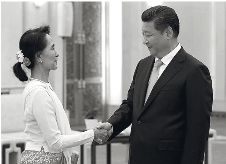
Председатель КНР Си Цзиньпинь и лидер оппозиции Мьянмы Аун Сан Су Чжи в Доме народных собраний. Пекин. 11 июня 2015 г.

Во время визита в Китай не поднимался болезненный вопрос о китайском правозащитнике Лю Сяобо, отбывающем 11-летний срок тюремного заключения, которому, как и Аун Сан Су Чжи, присудили Нобелевскую премию мира (2010 г.) «за длительную и ненасильственную борьбу за права человека», когда он находился в заточении. Впрочем, Аун Сан Су Чжи и дома до сих пор воздерживалась от высказываний по разным спорным вопросам – по проблеме мусульман-бенгальцев (т.н. рохинджа), о вооруженных столкновениях на севере страны с качинами и другими этническими группами, по этноконфессиональным конфликтам в Мьянме, что в последнее время все чаще вызывало критику в ее адрес со стороны правозащитников.