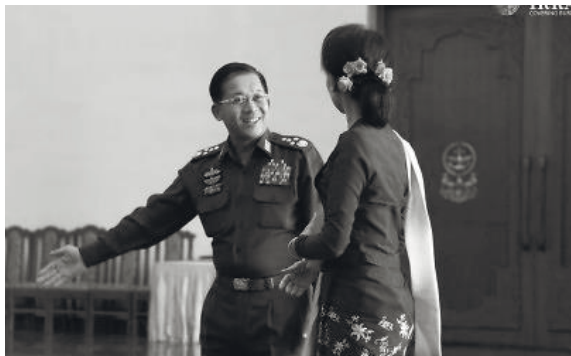
Главнокомандующий вооруженными силами Мьянмы старший генерал Мин Аун Хлаин и лидер НЛД Аун Сан Су Чжи. Нейпидо. 2 декабря 2015.

Отношения Аун Сан Су Чжи с армией, которую создал ее отец генерал Аун Сан, складывались непросто. Военная хунта держала ее под домашним арестом 15 лет. Наладились и даже «потеплели» их взаимоотношения после довыборов 1 апреля 2012 г. , когда Аун Сан Су Чжи стала членом парламента. Она даже неоднократно говорила о своем уважении к вооруженным силам Мьянмы, но считала, что армия должна стоять на страже интересов народа, а не воевать с ним и не подавлять его. Но затем она возглавила борьбу за внесение поправок в конституцию, не только в статью 59(f), преграждающую ей путь к президентскому посту, но и за пересмотр статьи 436 (а), наделяющей военную фракцию фактическим правом вето при голосовании о внесении поправок в конституцию. Лидер оппозиции собрала 5 млн. подписей под петицией, призывающей законодателей отменить право вето для военных. После провала этой кампании Аун Сан Су Чжи обвинила старшего генерала Мин Аун Хлаина в том, что он «препятствует демократии».