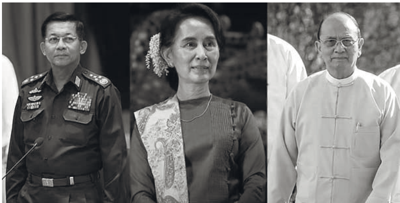
Судьба Мьянмы в их руках: главнокомандующий ВС, лидер НЛД, президент. (коллаж)