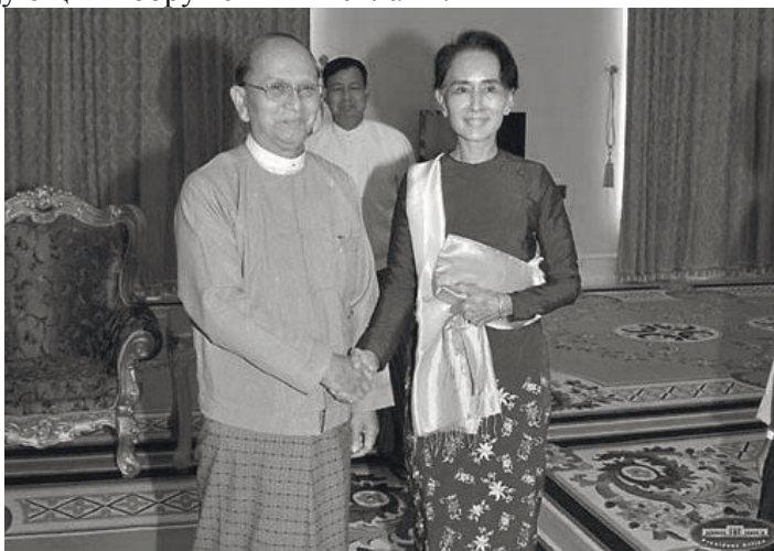
Президент Тейн Сейн и лидер НЛД в президентском дворце. Нейпидо. 2 декабря 2015

Историческая встреча состоялась 2 декабря 2015 г. – в первой половине дня с президентом, во второй – с главнокомандующим вооруженными силами.