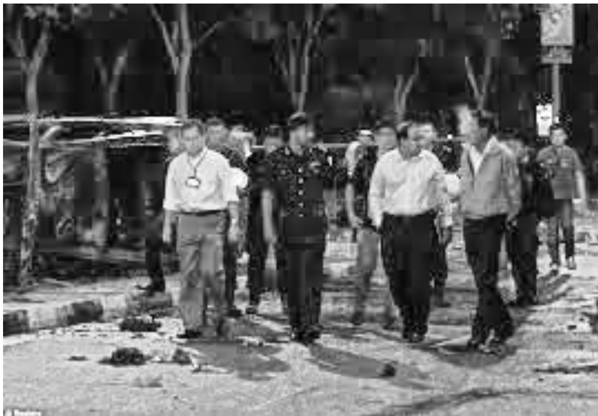
Премьер-министр Сингапура и его министры осматривают места беспорядков 13

Премьер-министр Сингапура Ли Сянь Лун заявил: «Какие бы события ни вызвали эти беспорядки, нет никакого оправдания для такого насильственного, разрушительного и преступного поведения. Мы не пожалеем никаких усилий для выявления виновных и накажем их по всей строгости закона».