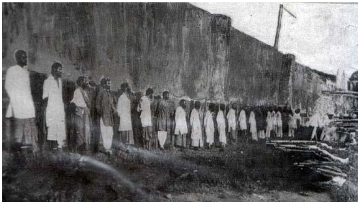
Публичная казнь осужденных мятежников, март 1915 г. 11

Возмездие было быстрым и суровым. В течение месяца состоялся военный суд над двумя офицерами и 200 рядовыми 5-го полка. Все, кроме одного сипая, были осуждены. Оба офицера и 45 сипаев были приговорены к смерти, 64 к пожизненному заключению, а оставшиеся к лишению свободы от года до двадцати лет. Одиннадцать человек из ФМГ, которые присоединились к мятежу, также были осуждены и приговорены к лишению свободы от 11 месяцев до двух лет. Казни проводились публично перед тысячами китайцев, малайцев и индийцев за пределами тюрьмы на Роуд Аутрэм в Сингапуре.