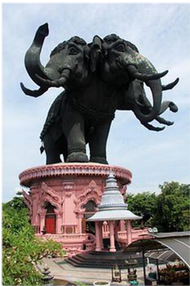
Музей слона в Самутпракане

Уникальное место, которое слоны занимают в современной культуре страны, связано с реалиями повседневного быта исторических тайцев, но также во многом и с религиозно-культурным влиянием Древней Индии, которое она оказала на тайские государства, включая Сукхотхай, Аютхая, Сиам. В древнеиндийской мифологии слоны занимают видное место. Из Индуизма в культуру Таиланда пришел образ Айраваты (по-тайски Эравана) – трехголового белого слона с четырьмя бивнями и семью хоботами, который является виханой , то есть средством передвижения бога Индры, светлого бога, царя богов и повелителя небесного царства. Эраван –