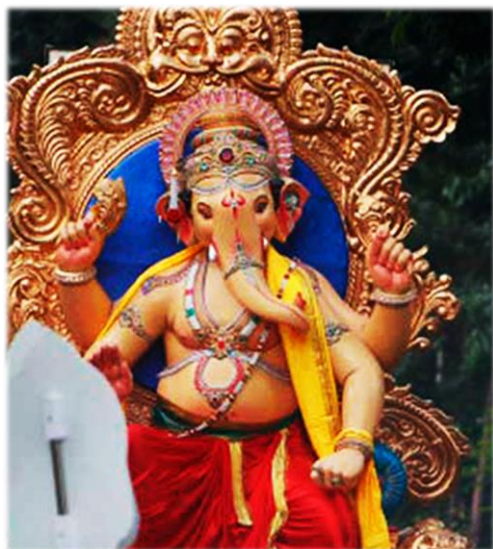
Статуя Ганеши в храме Уттахаян Канет в провинции Накхонсаван

лиц. По-тайски его имя звучит как Пхра Пхи Канет ( Phra Phi kanet или Phra Phikhanesawora ). Ганеша – бог мудрости, покровитель наук, образования, искусств и литературы. Он – символ благополучия и успеха. Ганеша считается покровителем писателей, путешественников, торговцев. Его благорасположением можно заручиться, если приносить ему подношения в виде фруктов и сладостей.