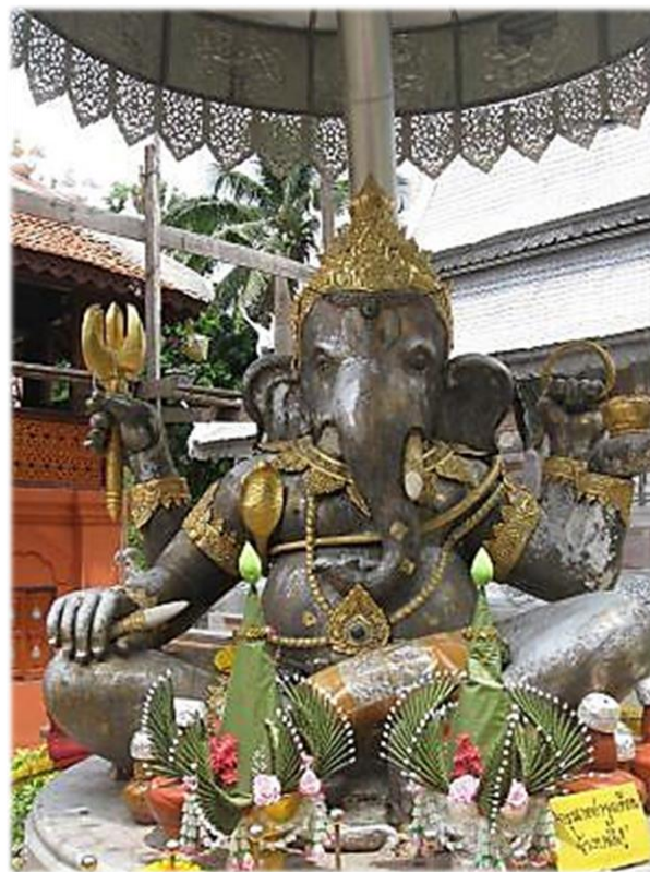
Серебряный храм в Чиангмае, статуя Ганеши

«Культура слона» проявляется во всех аспектах жизни тайландского общества. Тайцы относятся к слонам с уважением и любят их. Слон — объект религиозного поклонения, непреременный персонаж фольклора, пословиц, поговорок, сравнений, метафор, идиом. Например, выражение «белый слон», о некоем лице означает — «выдающийся человек». «Белый слон рождается только в джунглях»ช้างเผือกเกิดในป่า означает «хорошее трудно найти». «Мертвого слона не накроешь листом лотоса»ช้างตายทั้งตัวเอาใบไม้ปิดไม่มิด — «большие проблемы не спрячешь». 7 «Верхом на слоне ловить кузнечиков»