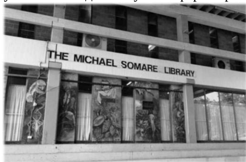
Библиотека Университета Папуа – Новой Гвинеи была названа в честь Майкла Сомаре в 1986 г. 19

Немалые успехи были достигнуты в сфере образования.