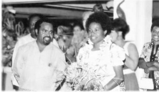
Майкл и Вероника Сомаре, 1965 г. 10

В 1970-х гг. М. Сомаре сопутствовал успех не только в политической карьере, но и в семье. В счастливом браке, который М. Сомаре заключил в 1965 г. с 19-летней Вероникой Каиап, познакомившись с ней вскоре после приезда в г. Вевак, появились пятеро детей. В 2016 г., отмечая свой 80-летний юбилей, М. Сомаре поблагодарил жену за стабильность, которую она ему подарила, всегда оставаясь ему самым верным и надежным другом 9 . Папуа-новогвинейцы с признанием называют первую леди страны Леди Вероника.