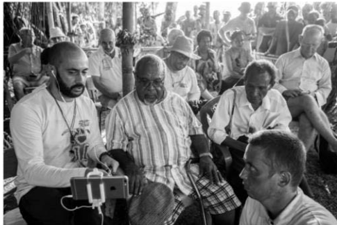
Сэр Майкл Сомаре и Маклай младший участвуют в телемосте «Россия – Папуа-Новая Гвинея», состоявшемся 20 сентября 2017 года.

MIKLOUHO-MACLAY XXI CENTURY. REVIVED HISTORY.