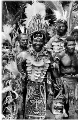
Майкл Сомаре в традиционном праздничном облачении. 1973 г. 11