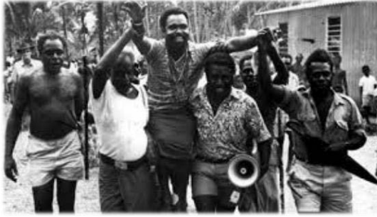
Папуа-новогвинейцы начали носить Майкла Сомаре на руках задолго до того, как тот стал «отцом нации». ПНГ. 1970-е гг. 3