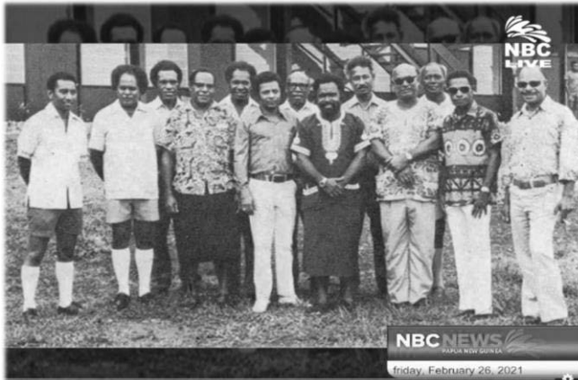
М. Сомаре на фото в центре, со скрещенными руками, в мужской «юбке» лап-лап 15 . 1976 г.

Наконец, 16 сентября 1975 г. была провозглашена долгожданная независимость, и ПНГ вышла из-под управления Австралии. М. Сомаре стал первым премьер-министром Независимого государства Папуа – Новая Гвинея. Празднование Дня независимости в ПНГ стало грандиозным событием и до сих пор остается самой значимой и памятной датой для всей страны, являясь официальным нерабочим днем. В этот день жители ПНГ с теплотой и благодарностью вспоминают заслуги «отца нации» – Майкла Сомаре.