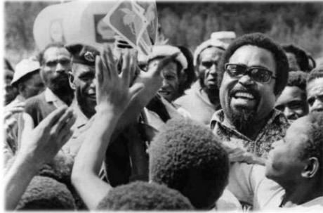
М. Сомаре раздает школьникам флаги ПНГ. 1974 г. 14

В 1974 г. ПНГ интегрировалась в сообщество независимых государств Океании, став членом Южно-Тихоокеанского форума (образован под эгидой Австралии и Новой Зеландии в 1971 г., включает все независимые страны и зависимые территории Океании, с 2000 г. носит название «Форум тихоокеанских островов» и является важнейшей региональной межправительственной организацией).