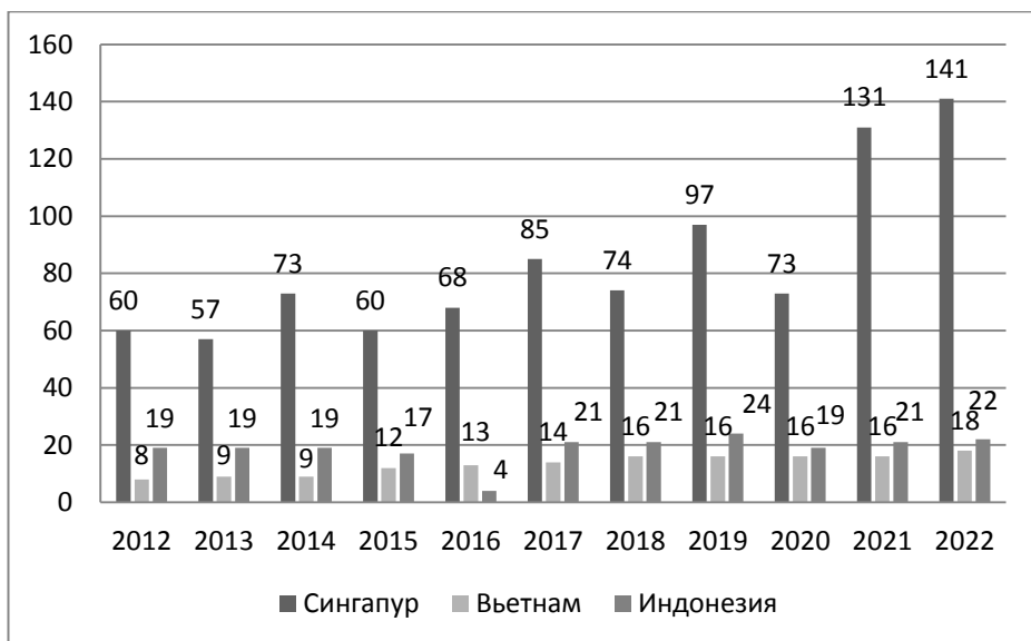
График 2. Ключевые страны-получатели ПИИ в ЮВА, 2012-2022 гг., млрд долл.

Среди ключевых стран-получателей по объему ПИИ в ЮВА в 2022 г. можно выделить Сингапур, Индонезию и Вьетнам, на которые приходится 63%, 10% и 8% всех инвестиций в регион соответственно (График 2). В связи с тем, что Сингапур относится к недружественной стране, далее фокус в работе будет сделан на Вьетнаме и Индонезии, как наиболее приоритетных внешнеэкономических партнерах РФ в регионе.