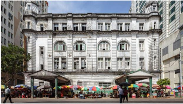
Бывшая штаб-квартира Бирманской нефтяной компании на Мерчант-стрит.

Другим крупным шотландским предприятием была компания Burmah Oil Co. (BOC) – позже ставшая British Petroleum . На логотипе компании был изображен чинте – мифическое бирманское животное, похожее на льва. Когда штаб-квартира Burmah Oil была перенесена из Глазго в Англию, два колоссальных чинте были размещены у входа,