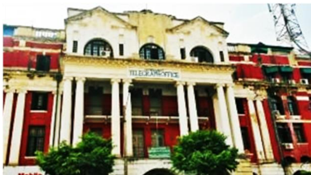
Центральное телеграфное отделение (1913–1917) архитектор Дж Бегг.

Центральное телеграфное отделение, спроектированное Джоном Беггом, и построенное в 1913-1917 гг., является типичным примером архитектуры эпохи Раджастана – его величественный фасад не выглядел бы неуместно на улицах Лондона. Бегг работал в Мумбаи и совершил только одну поездку в Рангун, прежде чем начертить планы различных административных зданий в городе.