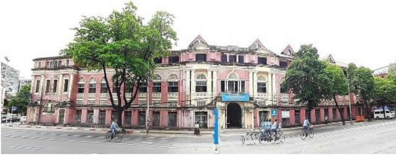
Здание бывшей правительственной типографии (1909–1912) архитектор Дж Бегг.

Здание бывшей правительственной типографии внесено в список объектов культурного наследия города Янгон как достопримечательность колониальной эпохи. Комплекс зданий расположен в северо-западной части Секретариата на Тэйньбью-роуд. Малоэтажный кирпичный комплекс был спроектирован шотландским архитектором Джоном Беггом и построен между 1909 и 1912 гг. Элегантный вход с греческими колоннами украшает главный фасад комплекса. В колониальную эпоху здание было центром распространения и типографией официальных правительственных изданий, включая газеты, журналы, новости и учебники. В постколониальную эпоху он стал издательским подразделением правительственного департамента печати и стационарных услуг Министерства информации, в котором работало более 1300 человек. Как отмечают сотрудники, «Здание прочное, вентиляция хорошая. Системы водоснабжения, электроснабжения и канализации в хорошем состоянии. Дневного света достаточно для работы, даже если отключат электричество. Британцы строили его довольно основательно».