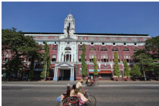
Здание таможни (1912–1916) архитектор Дж Бегг.

Центральное телеграфное отделение, спроектированное Джоном Беггом, и построенное в 1913-1917 гг., является типичным примером архитектуры эпохи Раджастана – его величественный фасад не выглядел бы неуместно на улицах Лондона. Бегг работал в Мумбаи и совершил только одну поездку в Рангун, прежде чем начертить планы различных административных зданий в городе.