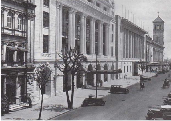
Новый офис IFC на улице Фэйр (Пансодан) в 1933 г.

Штаб-квартира IFC была одним из лучших зданий в Рангуне, наряду с домом генерального директора IFC, который в настоящее время является резиденцией британского посла.