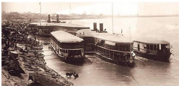
Пароходы компании Флотилия Иравади (IFC)

Знаменитая Флотилия Иравади Irrawaddy Flotilla Co. (IFC) была основана в Бирме в 1865 г. компанией «Тодд, Фундли и Ко», имевшей головной офис в Глазго, которая управляла пароходами, перевозившими пассажиров и грузы по сложной системе рек и водных путей Бирмы. Корабли IFC были изготовлены на верфи Denny's в Глазго, а затем отправлялись в Рангун по частям для повторной сборки. На пике своего могущества IFC располагала флотом из более чем 600 судов с малой осадкой, разработанных специально для навигации по приливным протокам дельты Иравади.