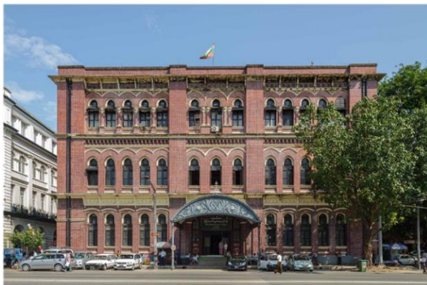
Здание офиса компании «Братья Буллок» 1908 г. Сейчас Главпочтамт в Янгоне.

В 1845 г. шотландскими братьями Джеймсом и Джорджем Буллоками была основана одноименная компания Bulloch Brothers & Co. , которая была крупным экспортером и импортером, производителем чугуна и латуни. Компания также занималась страхованием, судостроением и судоходством в качестве агентов British India Steam Navigation Co. , которая эксплуатировала пароходы между Рангуном и Калькуттой, Сингапуром и Мадрасом. Она монополизировала рисовую промышленность страны и была одной из крупнейших рисообрабатывающих компаний в Бирме, владевшей 4 мельницами в Рангуне и по одной в Бассейне, Акьябе и Моулмейне. Для очистки риса от шелухи шотландские экспортеры риса ввели паровые двигатели, построенные компанией Cowie Bros. в Глазго. Некоторые из этих машин – потрепанные и залатанные – до сих пор используются на рисорушках в небольших городах Мьянмы. Рис экспортировался в Британию и в соседние страны в регионе.