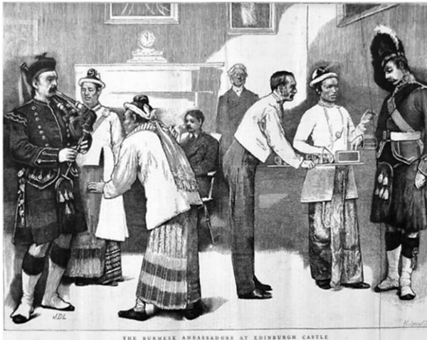
Бирманские посланники в Шотландии, 1872 год.

Считается, что шотландцы были первыми торговыми авантюристами Британской империи, и они прибывали в Мьянму толпами в поисках славы, богатства и выхода из жестких классовых структур викторианской Британии. Шотландские солдаты, государственные служащие и предприниматели сыграли важную роль в превращении Британской Бирмы из второстепенного форпоста индийской империи в экономический центр, которым она станет в начале двадцатого века. Их роль была настолько важна, что Бирму иногда называли «шотландской колонией».